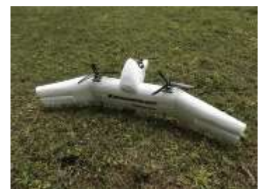
図 3 マルチコプターから飛行機になる垂直離着陸機