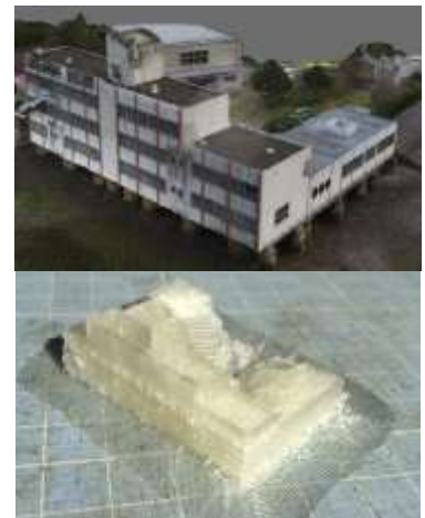
図 2 赤崎小学校の 3 次元データと 3D プリント出力例